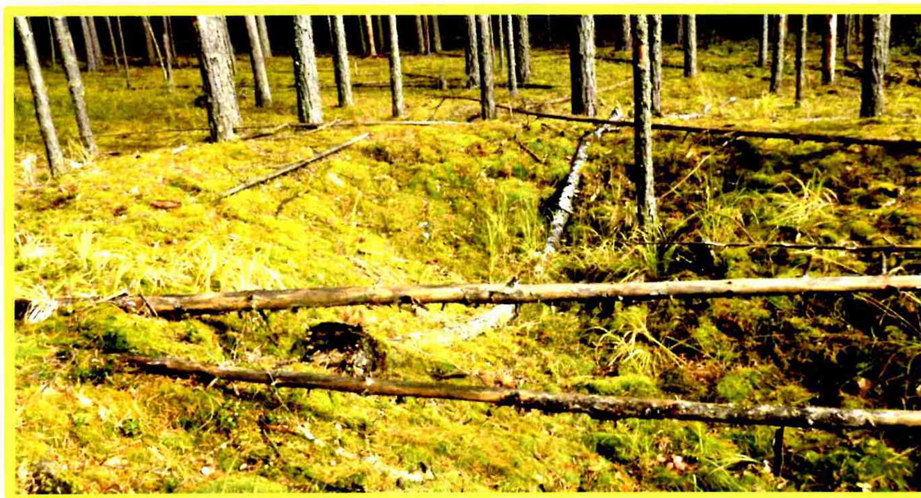
Изображение № 1 Валежник

Примеры валежника (смотри изображения №№ 1,2,3).